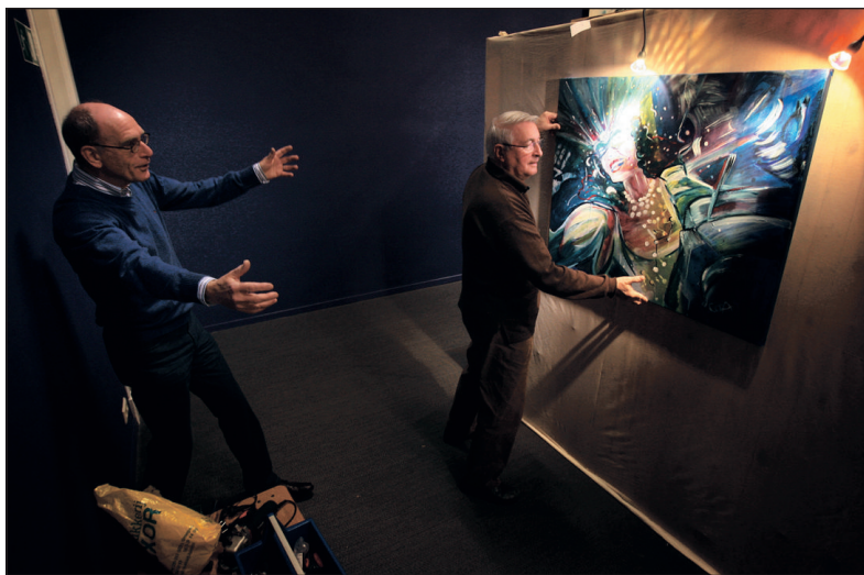
Het schilderij van Cora van Wanrooij krijgt een fraai plaatsje in de spotlights toegewezen.