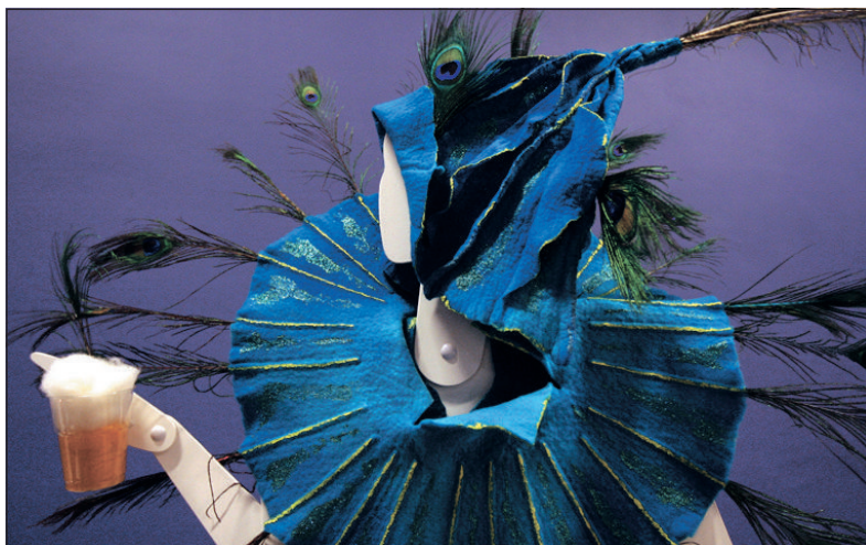
Bezoekers kunnen in de tentoonstelling van carnavalskunst inspiratie opdoen om een eigen carnavalskostuum in elkaar te knutselen.